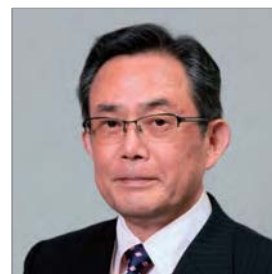
日本病院会 感染症対策委員会 副委員長 東京医療保健大学 名誉教授 平岩病院 院長

病院感染制御のレベルアップのために、関係各所の皆様による多数のご参加をお待ちしております。