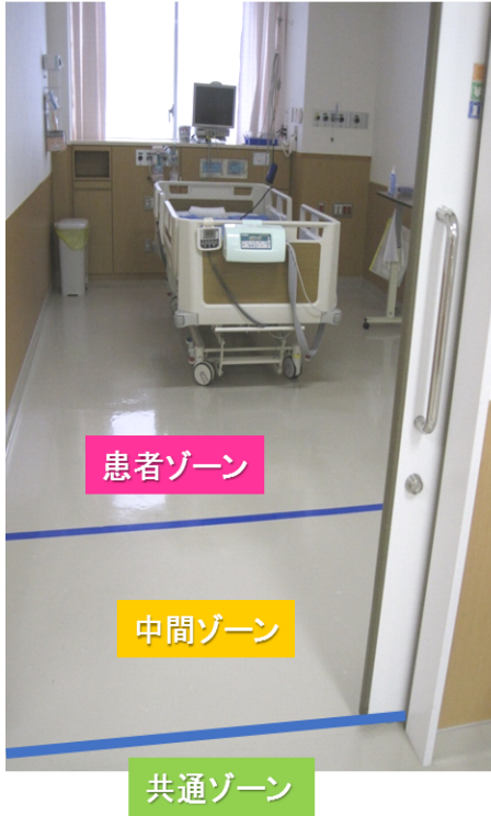
病室ゾーニングの1例