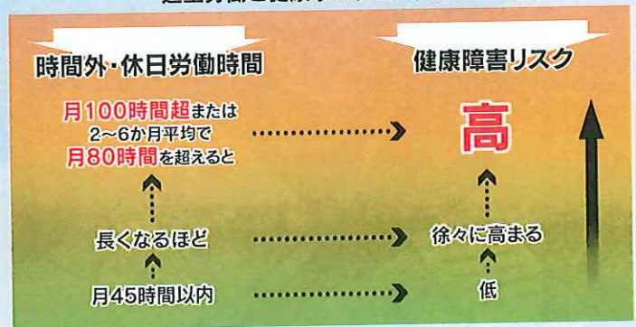
過重労働と健康リスクとの関連性

(右の図は、労災補償に係る脳・心臓疾患の労災認定基準の考え方の基礎となった医学的検討結果を踏まえたものです。)