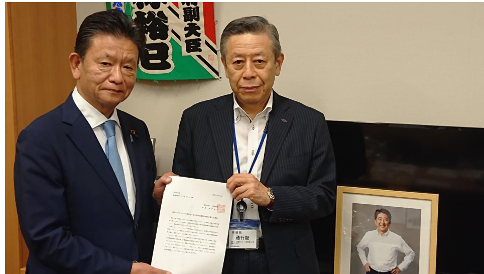
三ツ林裕巳衆議院議員