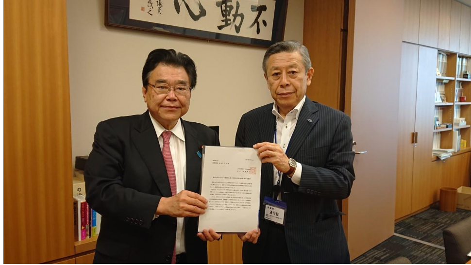
後藤茂之衆議院議員