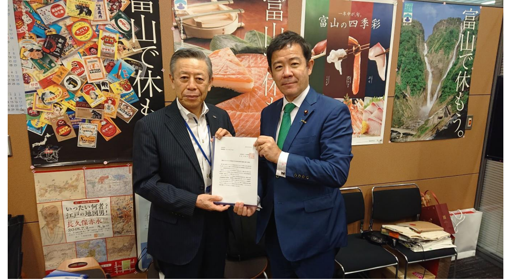
田畑裕明衆議院議員