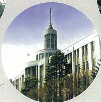
黒竜江中医薬大学佳木斯学院