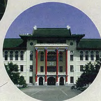
ハルピン医科大学