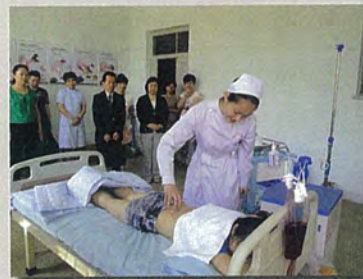
▶ 大学での実習の様子