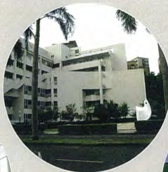
国立臺北護理健康大學