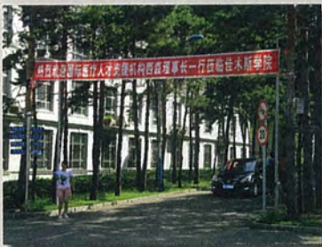
▶ 中国での説明会の様子