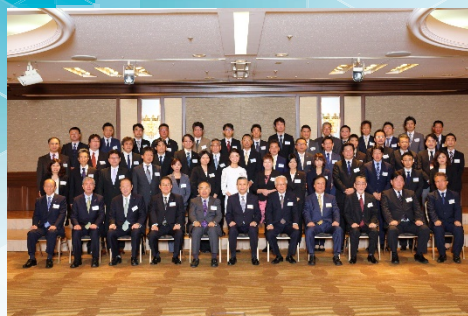
病院経営管理士教育委員会