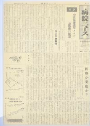
第 1 号（昭和 46 年 4 月 20 日）

平成 29 年 1 月 10 日：題字デザイン、活字サイズ、用紙サイズの一新作業が完了