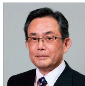
感染対策担当者のための セミナー筆頭講師 東京医療保健大学 名誉教授 平岩病院 院長

つきましては、わが国の病院感染制御のレベルアップのために、関係各所の皆様による多数のご参加をお待ちしております。