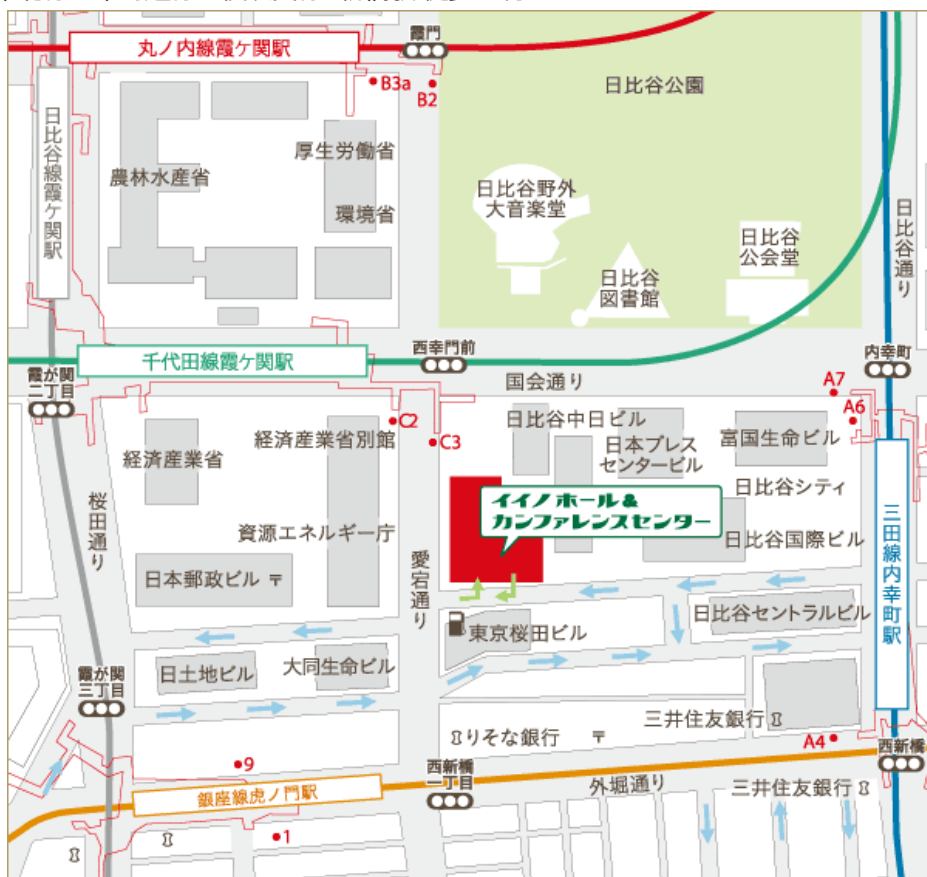
→ 飯野ビル駐車場出入口 → 一方通行 ※首都高速 霞が関ICより2分